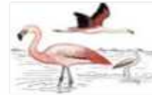
Manejo de Aves Amenazadas RN Junín

- Acciones orientadas a recuperar especies que por razones antropicas o naturales, sus poblaciones han sido diezmadas.