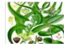
Manejo de Eucalipto RN Lachay

- Acciones orientadas a manejar, controlar o erradicar especies exóticas presentes en el ANP.